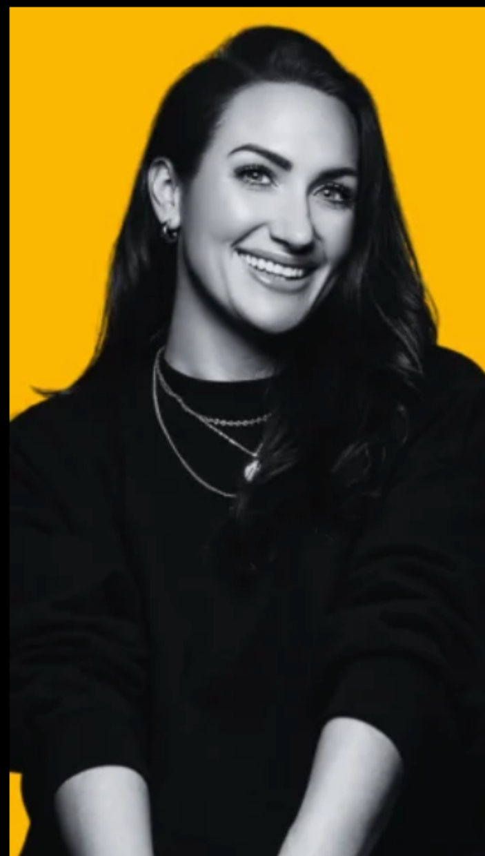
Prestatiedruk & faalangst